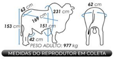
MEDIDAS DO REPRODUTOR EM COLETA