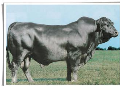
Avô paterno: Las Lilas 9305C Orozco Laspiur G5 (MONTERREY)