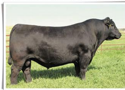
Pai: Sav West River 2066