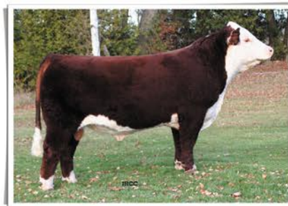
Pai: CC CX United 52S ET